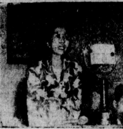
Mr. MARIA ULFAH SANTOSO Dulu Menteri Sosial — Sekarang Sekretaris Djenderal Perdana Menteri