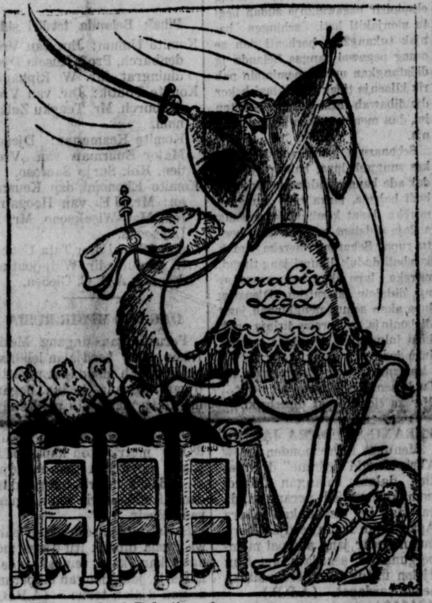
UNO membagi Palestina, dan .... Lembaga Arab menghunus pedangnja (Gambar: De Ronde Tafel).