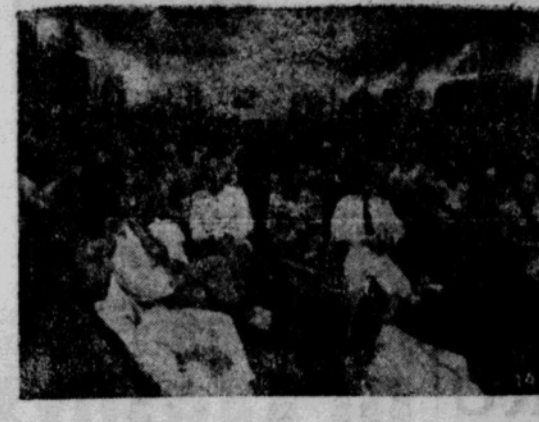
Missi NIT dalam satu pertemuan diistana Presiden.

Oleh: HASON SMITHO (Landjutan tanggal 25-3 j.l.) S AJA perlu uang belandja buat pulang." "Saja bisa kasi uang pandjar," djawab Nasobut. "Berapa tuan bisa kasi?" tanya Pandiam. "Saja kasi pindjam f. 50,— dengan perdjandjian, kalau dalam sepekan lagi tuan tidak datang, saja boleh lantas terbitkan tjerita itu didalam buku, dan honorariumnja saja akan tambahi seberapa yang saja rasa pantas." "Bolehlah," kata Pandiam. "Sebab saja perlu pulang maka saja mau terima uang 50 rupiah, kalau tidak karena itu, 200 rupiah belum mau saja terima buat harga naskah2 itu." "Ini tjuma uang pandjar, kalau tjeritnja bagus tuan bisa dapat